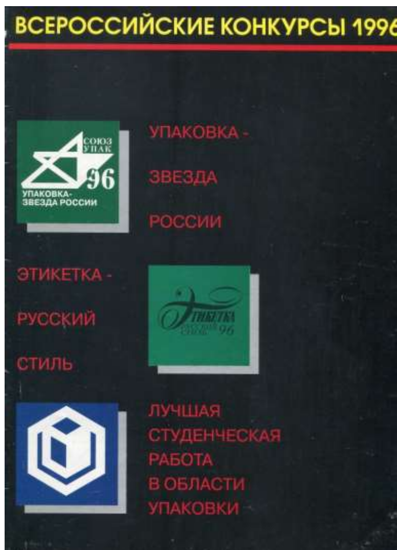
Обложка объединенного каталога победителей трех конкурсов, организованных журналом «Тара и упаковка» (1996 г.)