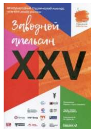
Обложки каталогов победителей конкурса «Заводной апельсин» в разные годы

Упаковочный сектор российской экономики полон талантов и свежих идей. В том числе для преподавателей и студентов российских университетов и колледжей, ежегодно посещающих или участвующих в профильных международных выставках в Москве, в регионах России и СНГ. Ведь посещение и участие в промышленных выставках с высокой эффективностью стимулирует и инновации в образовании. Каждый год студенты могут видеть и знакомиться с новыми и самыми современными технологиями, с лидерами отрасли, демонстрирующими свои последние достижения, продвигающие упаковочную индустрию вперед. И здесь же реально можно обсудить возможности будущего трудоустройства!