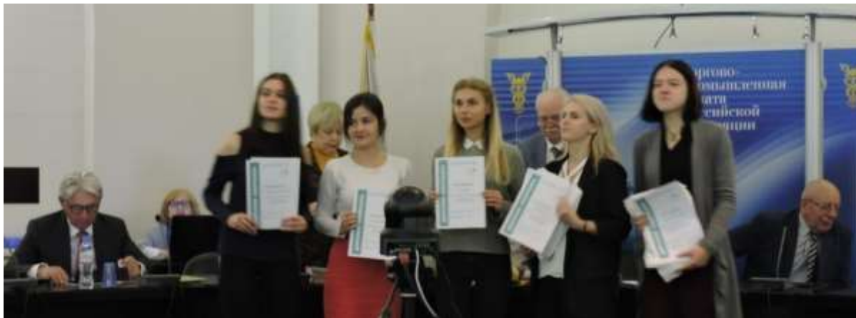
Официальная церемония награждения победителей студенческого конкурса «Заводной апельсин» не раз проходила в Торгово-промышленной палате Российской Федерации